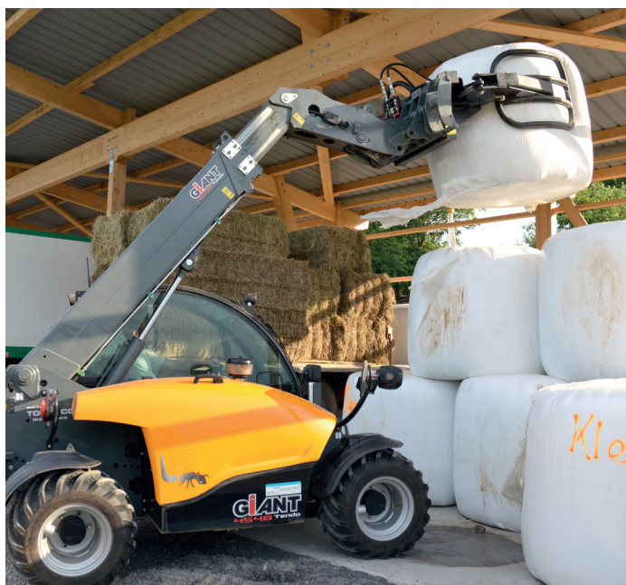
Kraftpaket: der Tendo schafft auch schwerste Siloballen