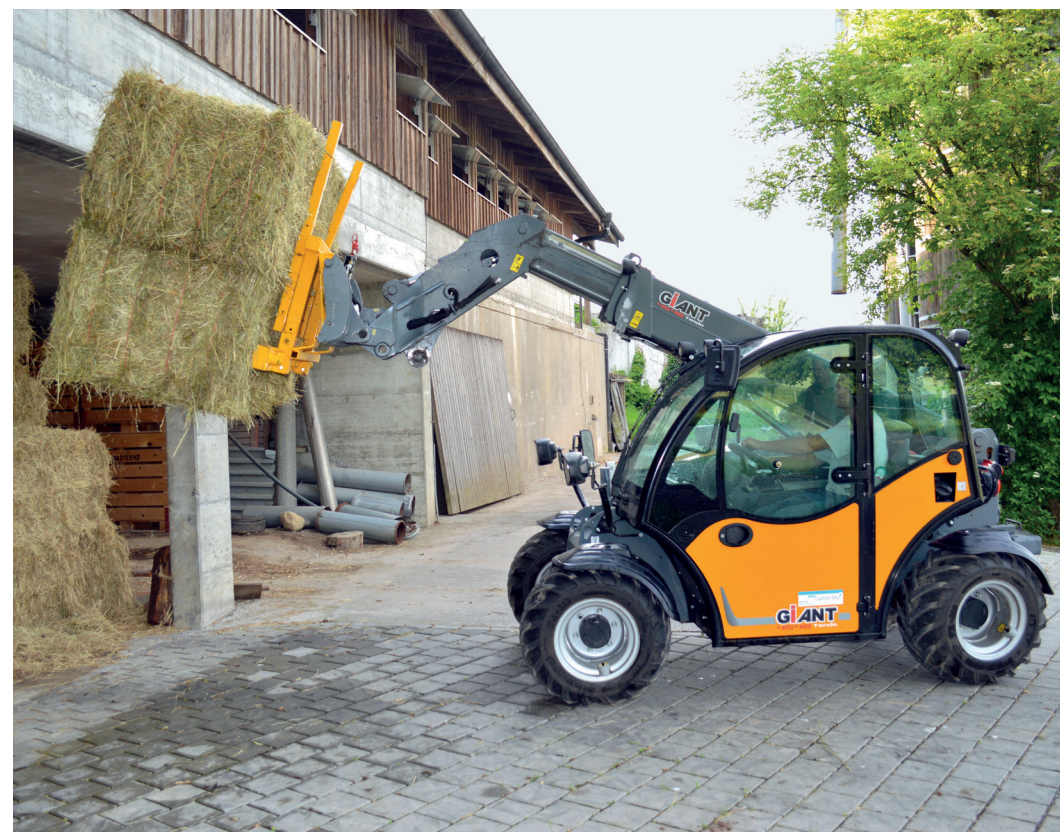
Der sehr kleine kompakte Teleskoplader mit der Riesenleistung.

Kompakt, Vielseitig, Bedienfreundlich und im Gegensatz zu Knickladern komplett sicher ist. Viele Maschinen, von Knicklader bis Teleskoplader, wurden geprüft, getestet und miteinander verglichen. Hansjörg Abt: «Beim Giant Tendo hatte ich einfach das beste Gefühl was meine Vorgaben betrifft.» Mit dem Tendo können jetzt viele Arbeiten wie